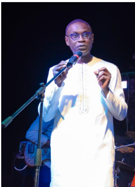
Le Chef cuisinier Pierre Thiam Ambassadeur de SOS SAHEL

En 2018 , les Africa Days ont mis en avant le grand potentiel des productions locales afin de pouvoir fournir aux populations urbaines et rurales d'Afrique une nourriture saine et nutritive, dans le cadre d'une économie locale dynamique et pourvoyeuse d'emplois. Il était également question d'échanger sur l'importance des partenariats pour structurer des filières locales durables .