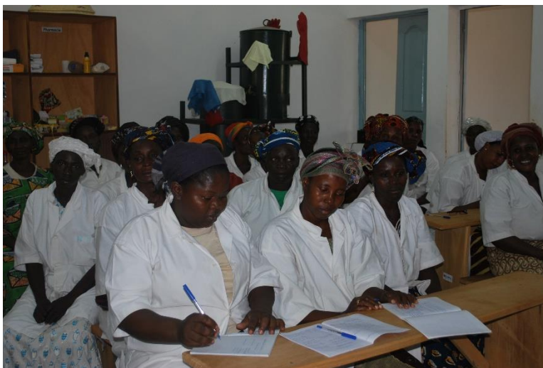
Femmes en formation sur la production de beurre de karité

Au Burkina Faso , SOS SAHEL contribue au développement du secteur du beurre de karité grâce à la mise à disposition de nouveaux moyens de productions et la structuration de la filière. Cette structuration a permis la création d'une entreprise entièrement gérée par des femmes (l'UPGGK). Grâce à la mécanisation partielle de la transformation du produit, et la diversification des productions, l'entreprise produit près de 250 tonnes de karité dont plus de 120 tonnes en qualité biologique, et permet à 5000 femmes de vivre de cette production.