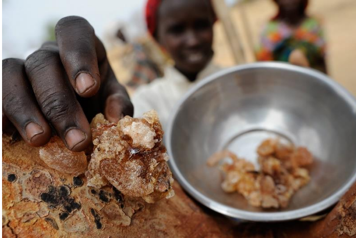
Cueilleuse de gomme arabique

Au Tchad , la filière de la gomme arabique mobilise un nombre croissant de producteurs et s'intègre dans une vision multisectorielle complexe du développement rural. Aujourd'hui, la filière fait vivre plus de 500 000 producteurs et productrices du Tchad. Le potentiel de la filière est important mais n'est, pour autant, pas encore totalement exploité. L'amélioration des performances du secteur doit se faire dans une vision cohérente et inclusive de toutes parties prenantes de la production.